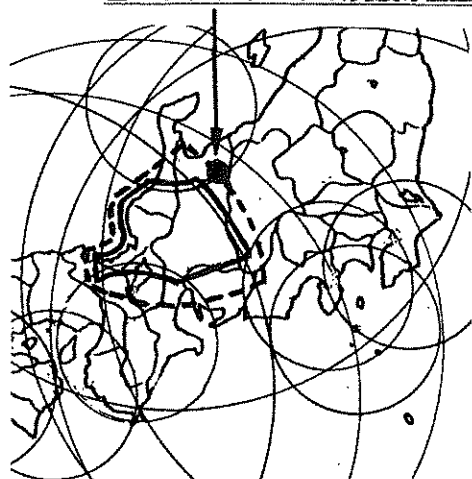
富山県東部(立山)群発震源位置

はできません。火山帯近傍地殻地震前兆がNo.1778前兆とは別前兆である場合は、No.1778推定領域は、左図点線内付近何処でもあり得ますが、火山前兆とNo.1778前兆に関連がある場合は、今回の富山東部群発震源に近い領域の可能性も否定できません。(立山群発震源は大枠推定領域境界線付近)